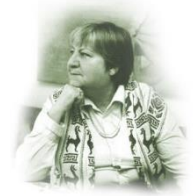
Gloria Fuertes 100 años

Con motivo del Día del Libro (23 de abril), que este año dedicamos a la escritora Gloria Fuertes, este viernes os invitamos a leer un poema de la autora antes de empezar cada clase.